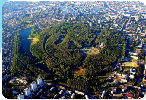
ЦПКИО П. П. Белоусова